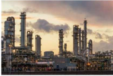
▲ Petrochemical & Chemical Industry