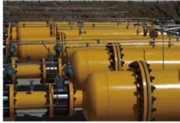
▲ Municipal Engineering & Utilities