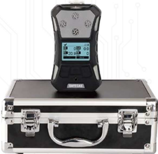
SKY3000 — Portable gas detector

SKY3000 시리즈는 여러가지 복합 가스(산소화합물 VOC, 가연성 가스, 유독성 가스 등)를 동시에 검출할 수 있는 고성능 휴대용 가스디텍터로, 맨다운 알람 및 진동, 사운드 알람 기능을 갖췄습니다.