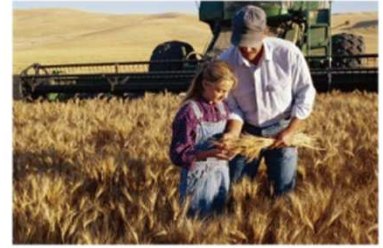
▲ Agricultural & Environmental Protection