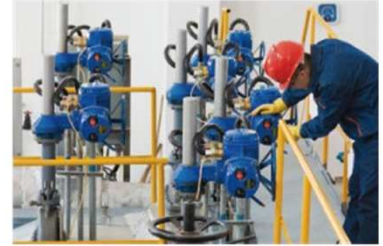
▲ Other Industries