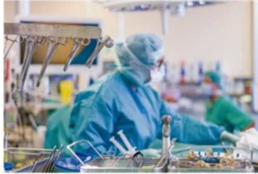
▲ Food & Pharmaceutical Industry